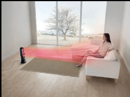
La fonction Jet Focus concentre le flux d'air sur le point choisi.