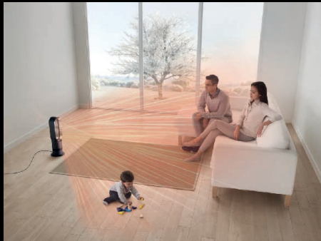
Le chauffage Hot+Cool™ de Dyson chauffe rapidement et de façon homogène.