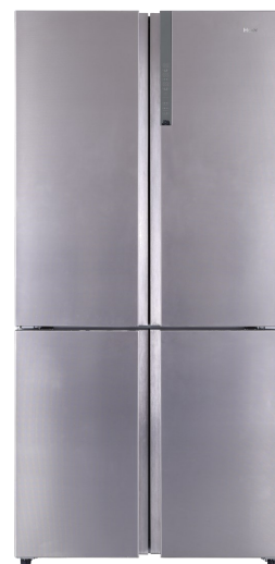
Visuel non contractuel