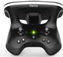
Parrot SKYCONTROLLER 2

Vivez une expérience de vol immersif d'exception avec les Parrot Cockpitglasses :